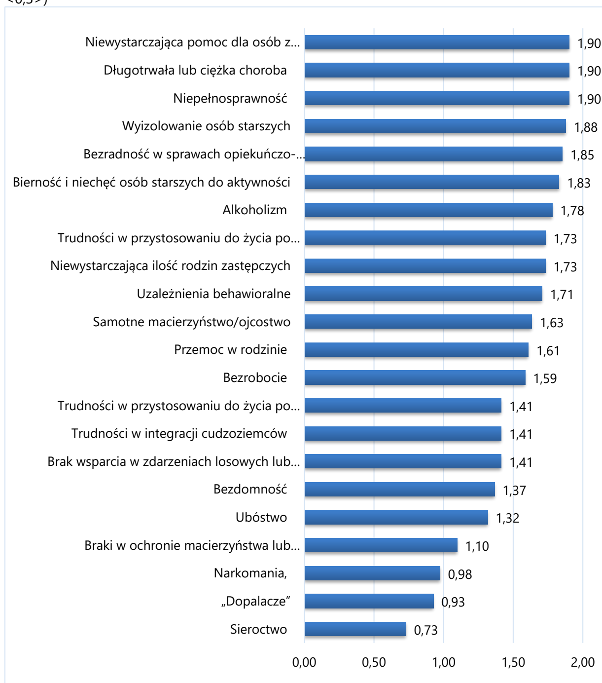
Rysunek 1. Występowanie negatywnych zjawisk w Koszalinie w opinii badanych (przedział <0;3>)